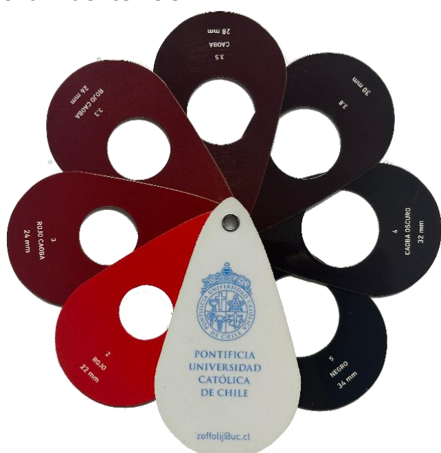
Figura 1. Tabla de intensidad de color de cubrimiento para cosecha de cereza chilena.

El diseño experimental fue completamente al azar, con cinco unidades experimentales por tratamiento. Cada unidad experimental estuvo compuesta por un árbol representativo, seleccionado según uniformidad vegetativa y carga frutal. Las aplicaciones se realizaron con un cubrimiento equivalente al 100% del volumen de hilera del árbol. Para la evaluación de calidad se recolectaron 50 frutos por unidad experimental. Se determinó diámetro ecuatorial, peso de fruto, distribución de calibres, firmeza mediante Durofel, sólidos solubles mediante refractometría y materia seca bajo protocolos internos del laboratorio Avium. La ganancia de color se estimó mediante un muestreo aleatorio estandarizado realizado en la misma fecha para los tratamientos dentro de cada investigación. Los frutos fueron clasificados según la tabla de intensidad de color de cubrimiento para cosecha de cereza chilena de la Pontificia Universidad Católica de Chile (Figura 1)